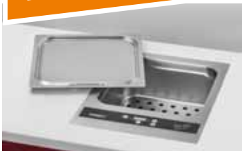
SANDRA PREMIUM – mit Edelstahldeckel