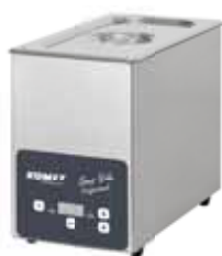
Weitere Größen erhältlich!