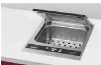
SANDRA EXCLUSIVE – mit Plexiglasdeckel